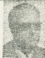
EL NOTICIERO UNIVERSAL